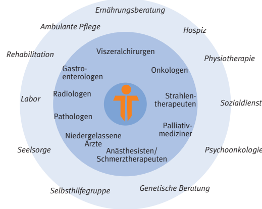
Ein Netzwerk von Spezialisten

Endosonografie mit histologischer Sicherung, Ultraschall, Röntgen, CT oder MRT. In der interdisziplinären Konferenz erfolgt die auf den Einzelfall angepasste Therapieplanung, stets auf Basis der neuesten anerkannten Behandlungsrichtlinien. Diese umfassen die operative Entfernung des Tumors, wenn immer möglich minimal invasiv (sog. Schlüssellochchirurgie), und/oder die ergänzende Chemo- oder Strahlentherapie vor oder nach einer Operation oder auch als alleinige Behandlung. Die Therapie wird ambulant oder stationär durchgeführt. Dies erfolgt in enger Kooperation mit niedergelassenen Ärzten. Mehr Informationen zur Therapie von Bauchspeicheldrüsenenerkrankungen und zu unserem zertifizierten Zentrum finden Sie unter www.evk-duesseldorf.de/pankreaszentrum