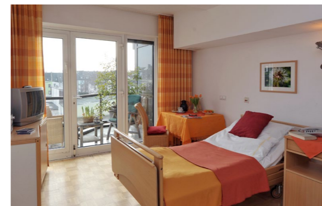
Das stationäre Hospiz wurde in einer mehrwöchigen Renovierung umfassend modernisiert.

Die Ehrenamtlichen leisten durch ihre unterschiedlichen Tätigkeiten einen wesentlichen Beitrag zum Gelingen der Unterstützung und Begleitung der Patienten und ihrer Angehörigen. Nach dem vorbereitenden Qualifizierungskurs sind sie an der Rezeption oder in der Wohnküche Ansprechpartner und bringen das ganz normale Leben mit ins Haus. Oder sie begleiten Patienten, die zuhause oder in einem der beiden Altenheime der Stiftung EVK leben, schenken ihnen Zeit und immer wieder lebenswerte Momente. Der nächste Qualifizierungskurs findet von März bis Juli 2012 statt. Nähere Informationen erhalten Sie unter Tel. 0211/919 - 4900.